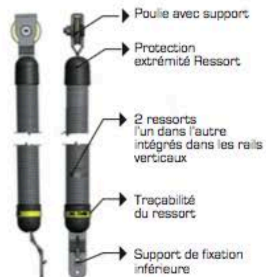
Poulie avec support