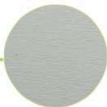
Sans motif Woodgrain