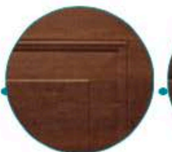
Cassette lisse chêne luxe