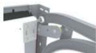
Double poulie et précadre pour limiter perte passage