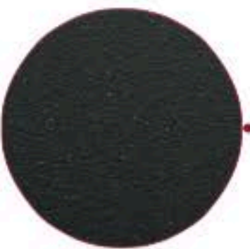
Polygrain lisse plaxé rapprochant 7016 plaxé