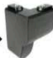
Pièce de jonction rails noirs