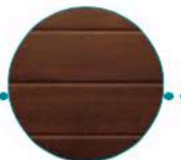
Rainuré lisse chêne luxe