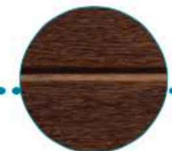
Monorainuré chêne luxe