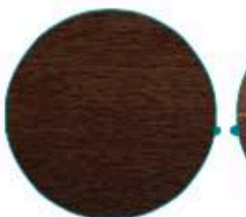
Chêne de luxe sans motif